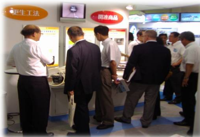
当ブースへの来場風景②