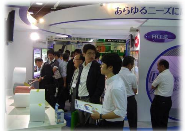
当ブースへの来場風景③