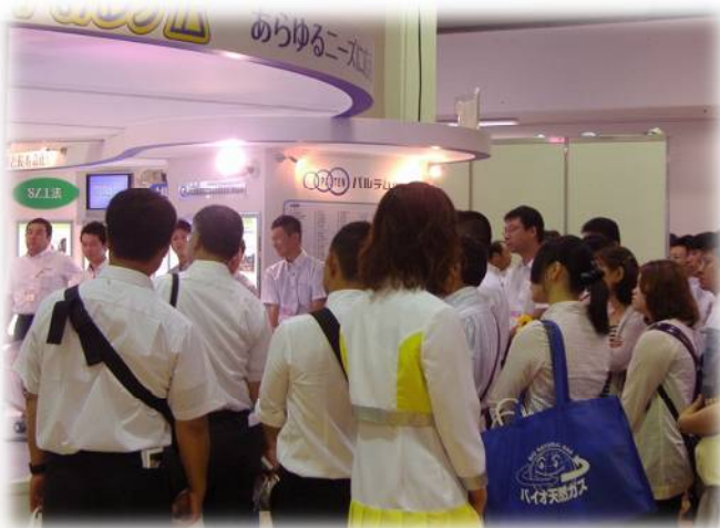
パルテムSZ工法の地盤追従性 プレゼン風景②