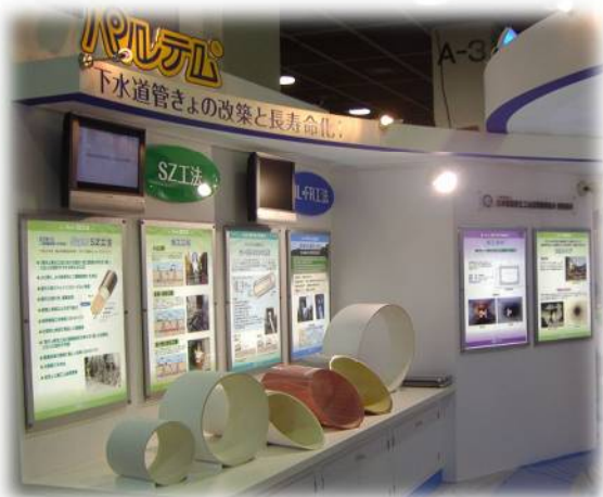
ホースライニング工法および パルテムSZ工法の展示

当ブースへの来場者は下水道展の総入場者77,452人に対して約1,500人前後の見込みで、重ねて来場者各位に感謝申し上げます。