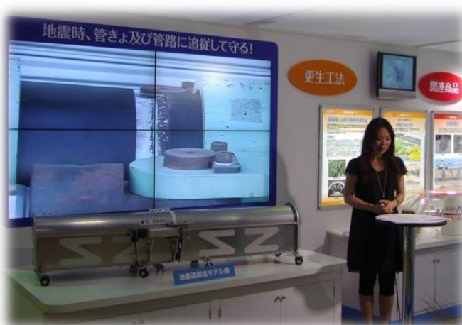
パルテムSZ地盤追従性デモ機と マルチスクリーンでの放映