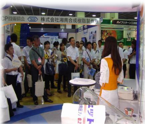
パルテムSZ工法の地盤追従性 プレゼン風景①