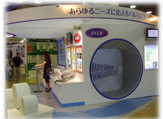
パルテム・フローリング工法 『円から四角に』のモデル展示